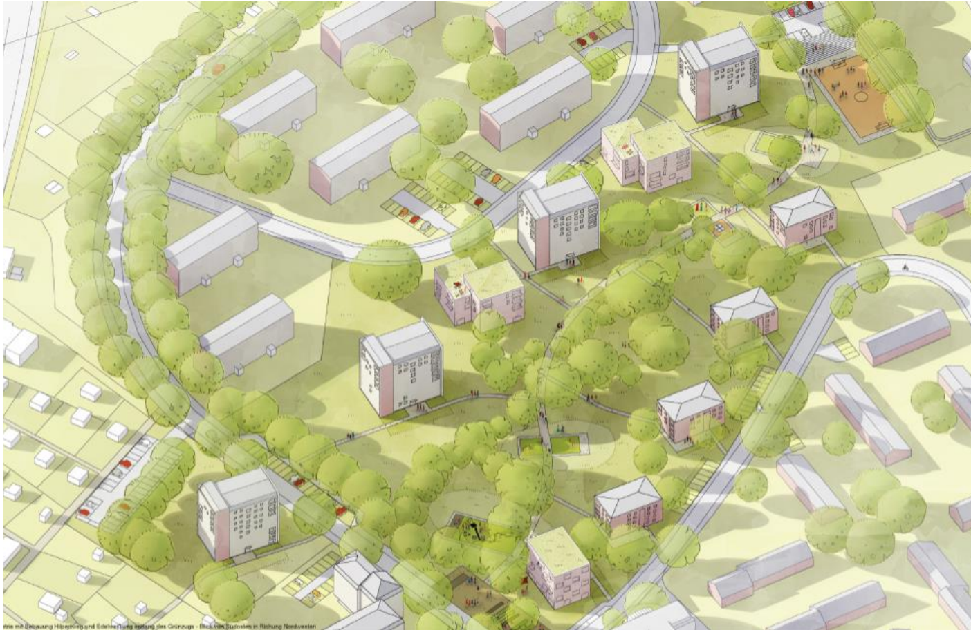
Blick mit Deckung Höhen und Edelebung des Grundrisses - Blick über das Viertel in Richtung Nordwesten

Vorstellung des prämierten Entwurfes durch Hahn Hertling von Hantelmann und eins:eins Architekten BDA